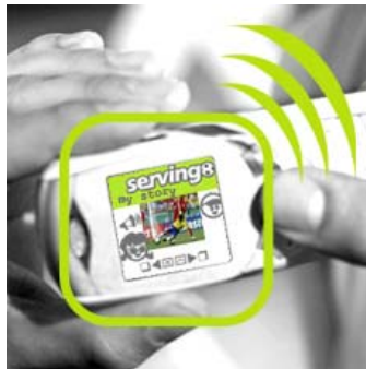
Nutzung mobiler Endgeräte

Das servingo Projekt soll den effizienten und innovativen Ablauf der FIFA WM 2006 fördern und eine IT-gestützte Serviceplattform schaffen, die es erlaubt bei sportlichen oder sonstigen Großveranstaltungen eine integrierte Informations- & Logistikunterstützung über verschiedenste Zielgruppen hinweg anbieten zu können.